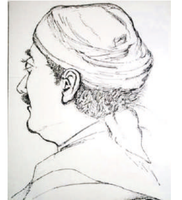
ચિત્રાંકન : શ્રી એસ. એસ. ઠક્કર, મ.શિ, શ્રી વિવિધલક્ષી વિદ્યામંદિર

પણ મેઘાણીએ નમ્રતાપૂર્વક જણાવ્યું કે, મુરબ્બી હું તો આપનું સંતાન છું. હું તો ચારણોનો ટપાલી છું!