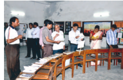
પ્રદર્શન નિહાળતા ટ્રસ્ટના પદાધિકારીશ્રીઓ