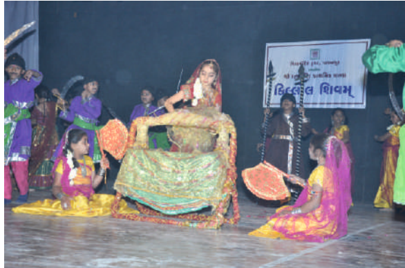
શ્રી રાજમણિ પ્રા.શાળાના રંગોત્સવમાં રજૂ થતું મેઘાણી રચિત શિવાજીનું હાલરડું