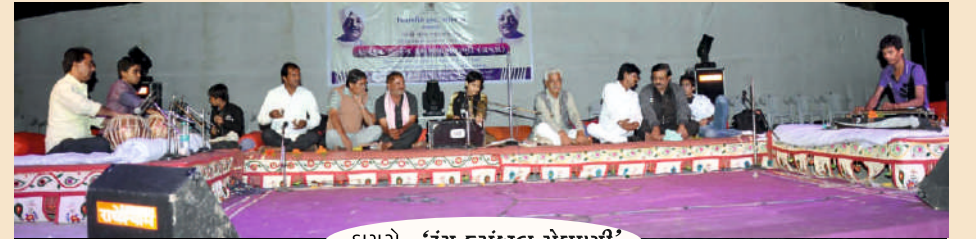
ડાયરો- 'રંગ કસુંબલ મેઘાણી'