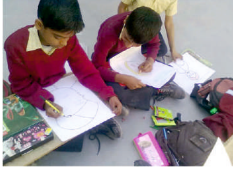
ધો. ૩,૪,૫ ચિત્ર સ્પર્ધા Smt. M. M. Mehta Eng. Medium School

ગાંધી બુદ્ધ સ્વાધ્યાય કેન્દ્રના ઉપક્રમે ઝવેરચંદ મેઘાણી જીવન પ્રકલ્પ વર્ષ ટ્રસ્ટ સંચાલિત સંસ્થાઓના પુરસ્કૃત વિદ્યાર્થીઓ