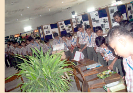
પ્રદર્શન નિહાળતા સંસ્કાર વિદ્યાલયના વિદ્યાર્થીઓ