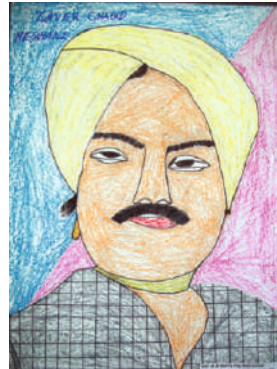
Drawing : Shrutii Parimal