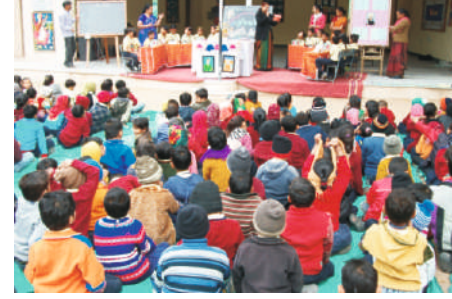
કવિઝ- શ્રી જૈન શિશુશાળા

૧૯૩૬ પછી ‘ફૂલછાબ’માં વિવેચનાત્મક લખાણો લખતા હતા તે પરથી ‘પરિભ્રમણ’ના ત્રણ ભાગો પ્રગટ થયા હતા, તેમાં તેમનું વિવેચનાત્મક સાહિત્ય સંઘરાયેલું પડ્યું છે.