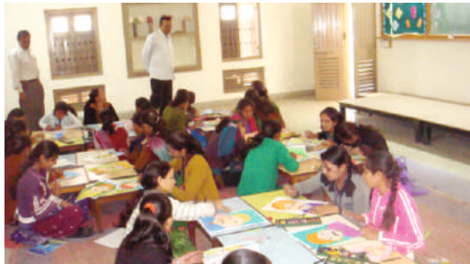
Drawing Competition : Shri K. J. Mehta College of Pre- Primary Education