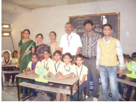
ક્રિયક્રમ : શ્રી રાજમણિ પ્રા.શાળા (વિજેતા ગ્રુપ)