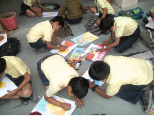
ચિત્ર સ્પર્ધા શ્રી રાજમણિ પ્રા.શાળા

મેઘાણીના પત્રકારી લખાણમાં જન્મભૂમિના ‘કલમ- કિતાબ’નો પહેલો નંબર આવે છે, બીજો નંબર આવે છે તેમના ‘વેરાનમાં’ ના પ્રસંગચિત્રોનો અને ત્રીજો નંબર આવે છે ‘નરવીર લાલાજી (૧૯૨૭)’, ‘સત્યવીર શ્રદ્ધાનંદ (૧૯૨૭)’ વગેરે સાત-આઠ જીવનકથાનાં પુસ્તકોનો.